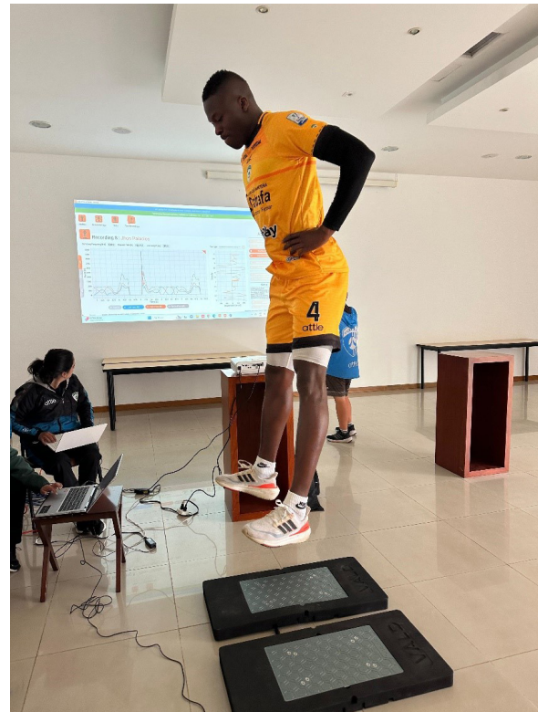
Imagen 1: ForceDecks+CMJ TEST